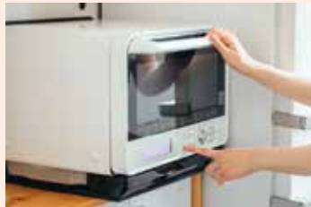
電子レンジ microwave / 微波炉 / lò vi sóng