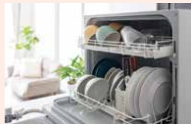
食洗機 dishwasher / 洗碗机 / máy rửa bát