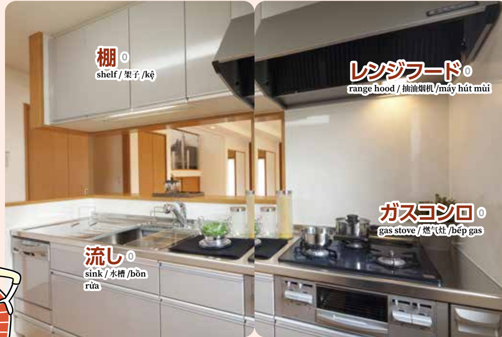
棚 shelf / 架子 / kệ