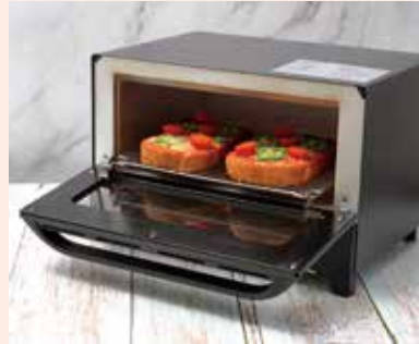
オーブン トースター oven toaster / 烤箱 / lò nướng