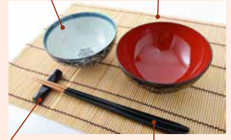
箸置き chopstick holder / 筷子支架 / kê đũa