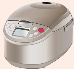
炊飯器 rice cooker / 电饭煲 / nồi cơm điện