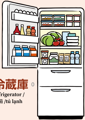
冷蔵庫 refrigerator / 冰箱 / tủ lạnh

kitchen appliances / 厨房电器 / thiết bị nhà bếp