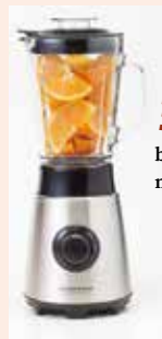
ミキサー blender / 搅拌机 / máy xay